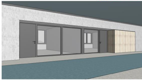
Zugang zu den Klassen