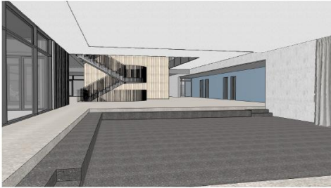
Blick von der Bühne zur gem. Mitte