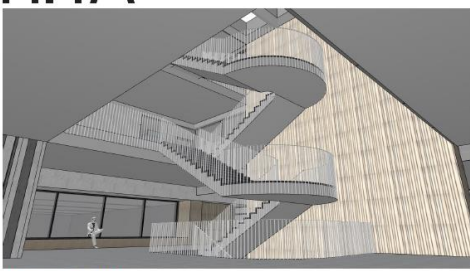
Treppe der gemeinsamen Mitte